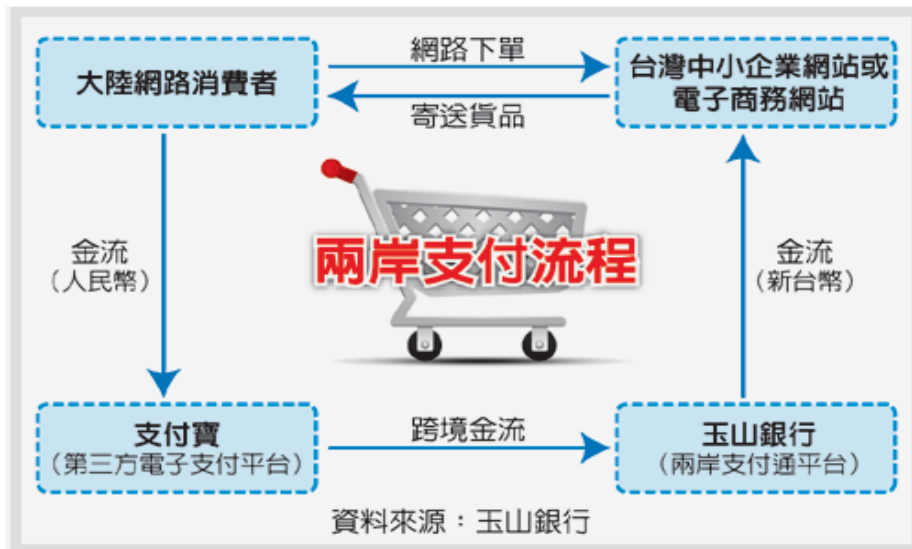
圖 3 兩岸支付流程

根據圖 3，對於中國的買家或賣方業者來說，他們的金流只需對支付寶直向流通。而對台灣的買方或是賣方業者來說，將交易交由玉山銀行進行或是直接由支付寶付款讓兩岸的買賣雙方有共同的金流平台。