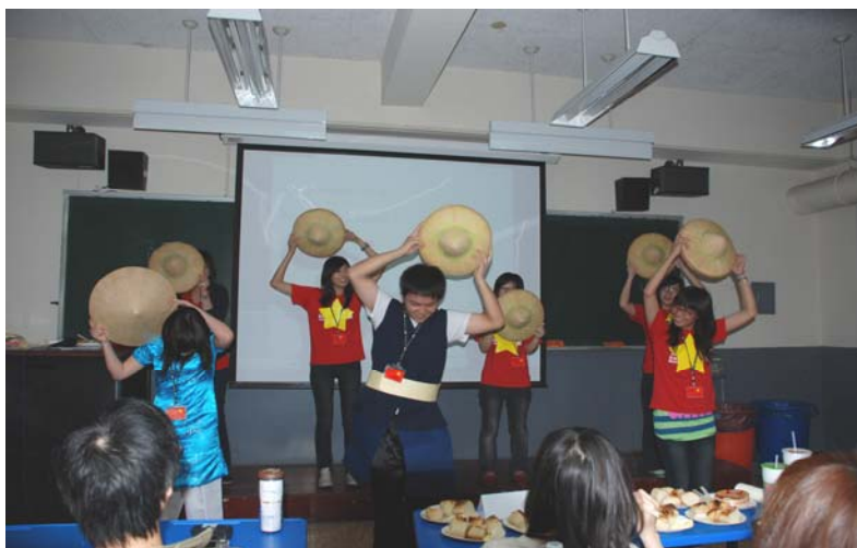
舞蹈表演 ↓ 斗笠舞