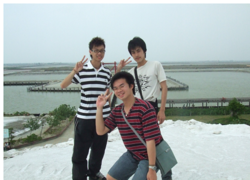
(圖十二)登上風景優美的鹽山頂峰，