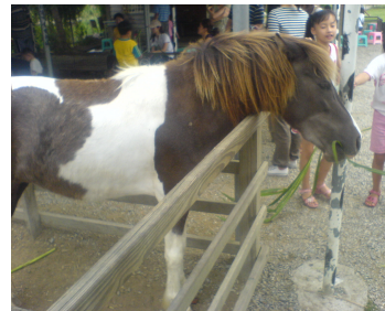
(圖十) 活力十足的馬