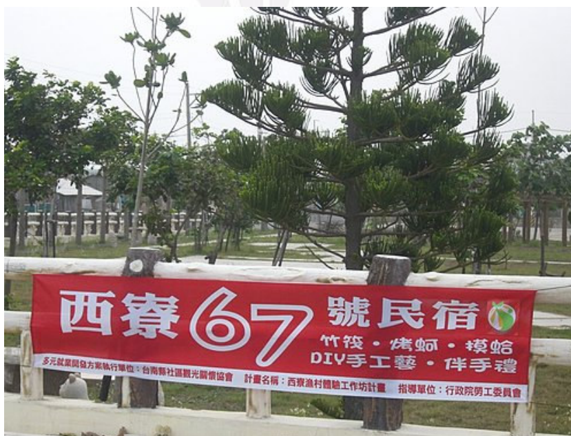
(圖十九) 西寮 67 號民宿旗幟