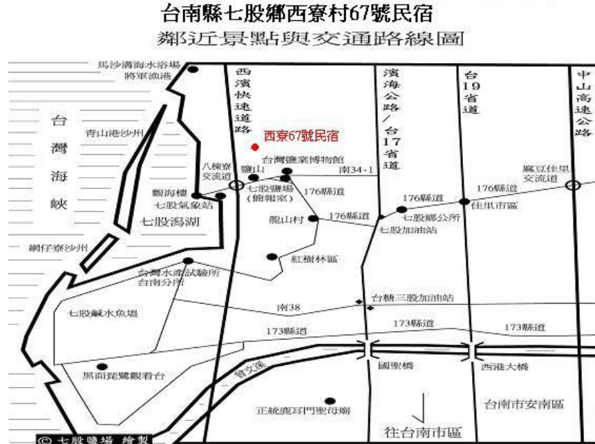
(圖三)西寮 67 號民宿地圖指標：