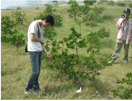
(六) 本小組組員實際地體驗紅樹林