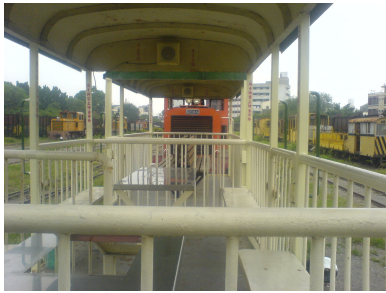
(圖八) 五分車(小火車)