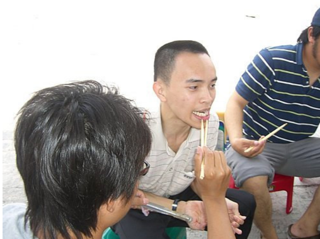
(圖十八) 在家靠父母，出外靠朋友，發揮友愛的精神(註1)