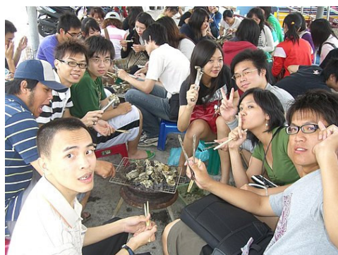
(圖十一)大家團聚、親自烤蚵