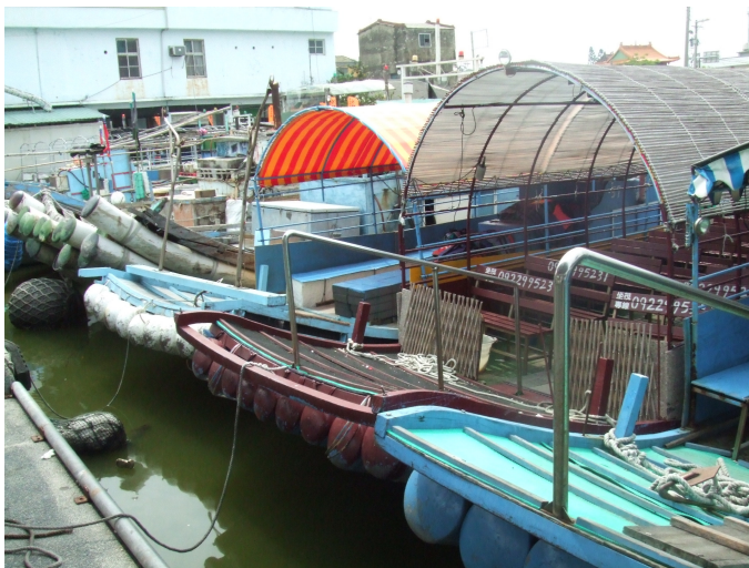
(圖十七) 這些可是漁民們賴以維生的工具呢！